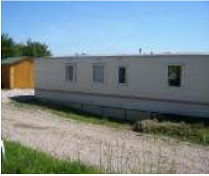
Het Mobil Home van 12 mtr.lang en 3.20 mtr breed met het houten schuurtje.