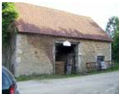
De tot de gite 'La Grange' om te bouwen schuur.

Op het terrein staat een hele mooie oude schuur met muren van een halve meter dik, mèt een electra-aansluiting !