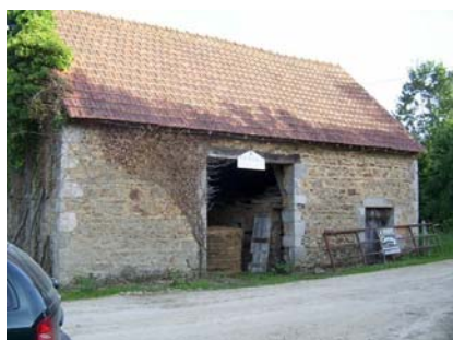
La Grange bij aankoop najaar 2005

Al met al is er nu weer het nodige gedaan en als je terug kijkt is dat goed te zien.