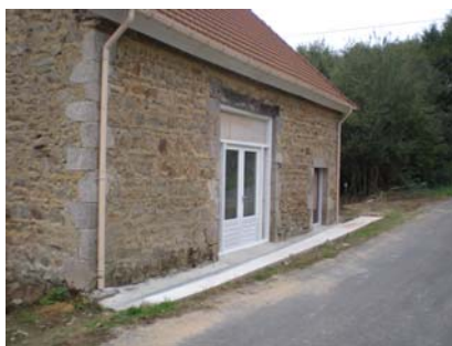
La Grange september 2009

In de eerste week van deze vakantie was er sprake van een "Indian Summer" met temperaturen boven de 20 ° C.